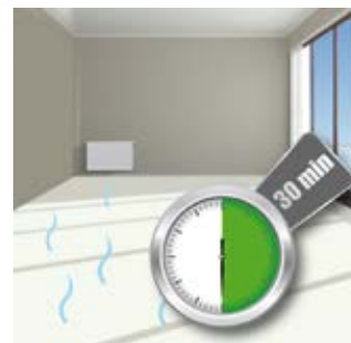
Επίστρωση των «νωπών» λινοταπητών